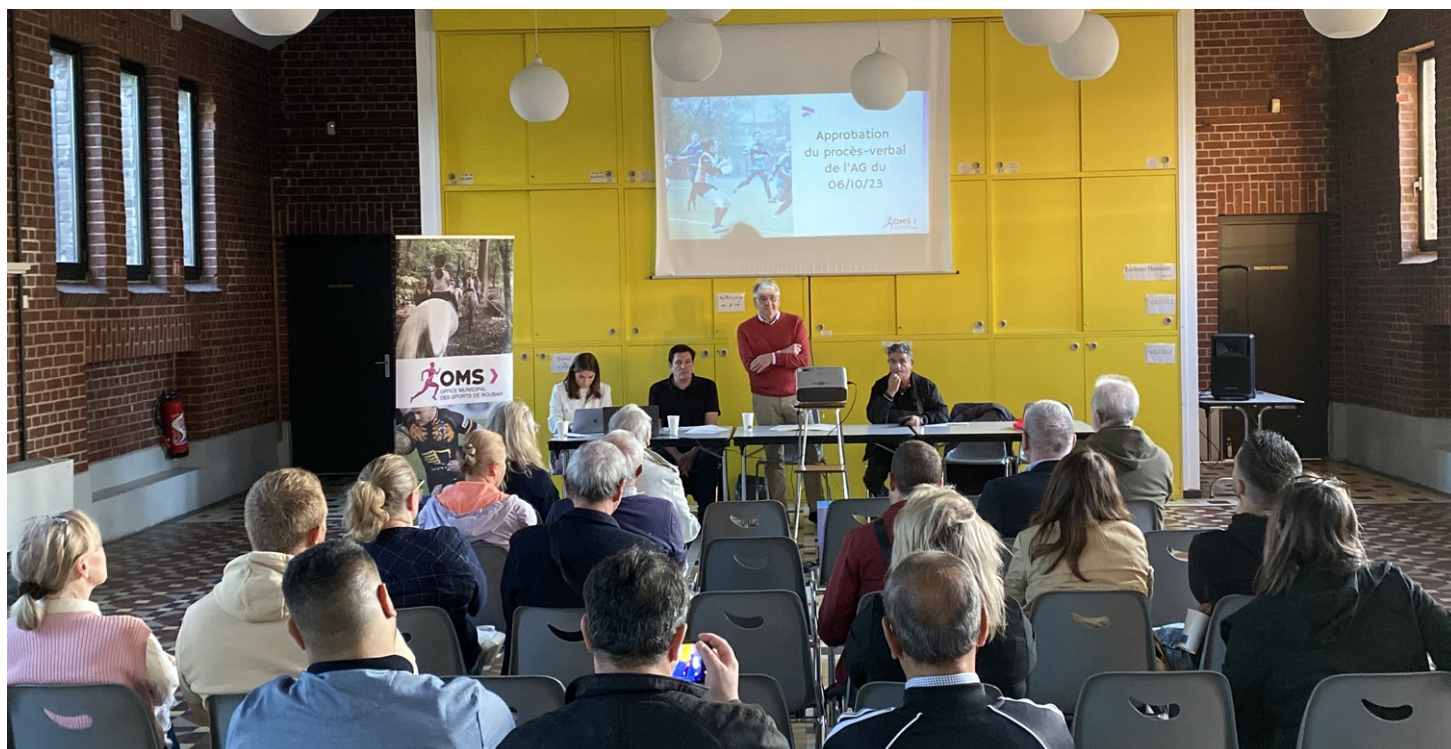
Assemblée Générale de l'OMS - 06/10/2023