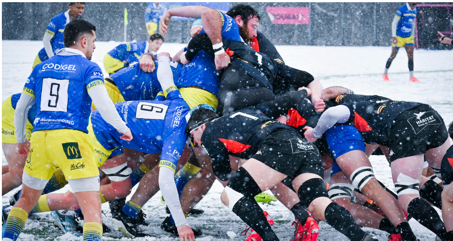
Rugby Club Roubaix vs Plaisir Club Rugby - 15/02/2026