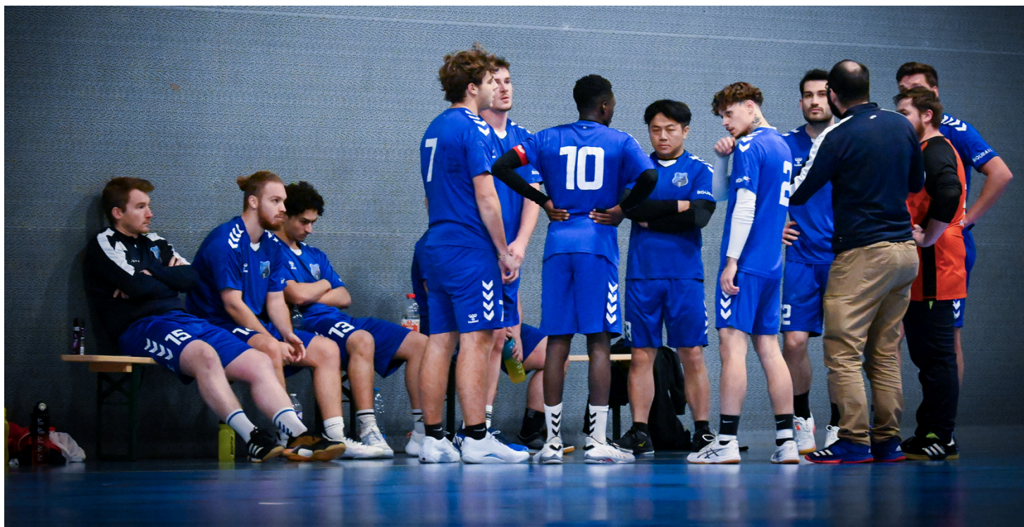
Roubaix Handball Club - 22/11/2025