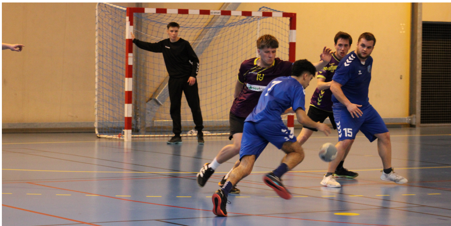
Roubaix Handball Club vs Wallers Arenberg - Championnat Départemental 3 - 29/03/2025